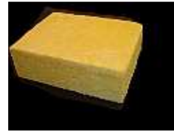
Lã de Vidro/ Lã de Rocha