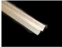
Tabica s/ Furo