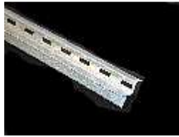
Tabica c/ Furo