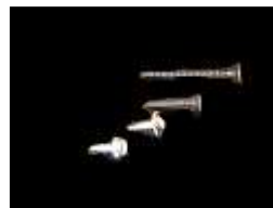
Parafusos, Rebites, Buchas