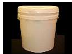
Massa p/ Tratamento